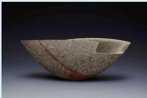
瀬戸内市立美術館 隠崎隆一「備前混濁広口花器」2010年

※予算上限に達し次第、受付終了となります。※身分証明書及び所定の申請書等の提出が必要となります。※「おかやま旅応援割」は新型コロナウイルス感染拡大状況によっては変更・停止・中止する場合があります。※岡山県在住の方に限ります。