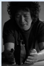
隠崎 隆一 陶芸家

隠崎隆一 (1950～) は現代の備前焼を代表する陶芸家の一人です。明快で有機的なフォルムと計算された緻密な焼成。そして備前焼の未来を見据えた陶土の開発や用い方によって、制作全体を計画・設計するデザイン力に特徴があります。