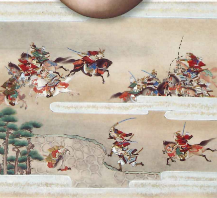
▲平家物語絵巻 巻9上 木曾の最期の事 (林原美術館)