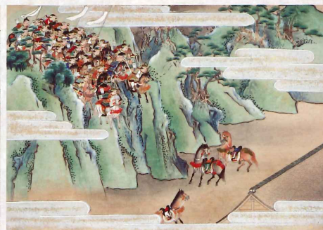
▲平家物語絵巻 巻9下 坂落しの事 (林原美術館)