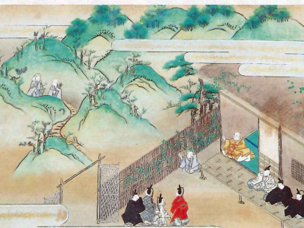
▲平家物語絵巻 巻12下 小原御幸 (林原美術館)

「祇園精舎の鐘のこえ、諸行無常のひびきあり」ではじまる『平家物語』は、平安時代末に栄華を極めた平氏一門の栄枯盛衰をつづった物語です。この物語は鎌倉時代にうまれてから現代まで語り続けられてきました。林原美術館に所蔵される「平家物語絵巻」は美しい紙に書き写された本文と、細密に描かれた700場面以上の絵によって『平家物語』全体を鑑賞できる名品です。 江戸時代に作られたこの絵巻はかつて越前松平家に所蔵されており、今回はその里帰り展となります。本展ではこの「平家物語絵巻」に描かれた名場面を通じてストーリーをたどりつつ、文学・美術・芸能など多彩な文化の土壌となった『平家物語』の世界をご紹介します。