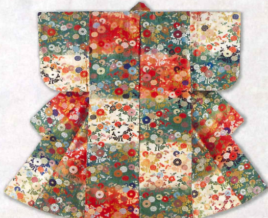
▲段に菊文唐襦袢 (林原美術館)