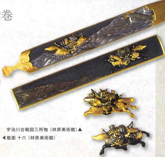
▲宇治川合戦図三所物 (林原美術館) ▲能面 十六 (林原美術館)