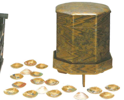
国指定重要文化財 《綾杉地獅子牡丹蒔絵婚礼調度 貝桶・彩色貝》 江戸時代前期(17世紀)