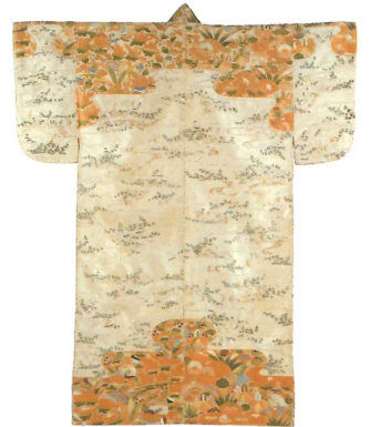
国指定重要文化財 《白地草花文肩裾縫箔》 桃山時代(16世紀) ※後期展示