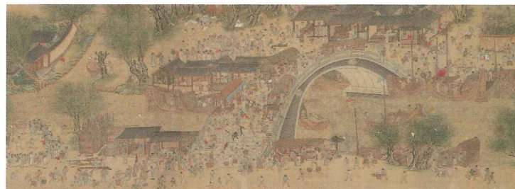
国指定重要文化財 趙浙《清明上河図》(部分)中国・明時代 万暦5年(1577)