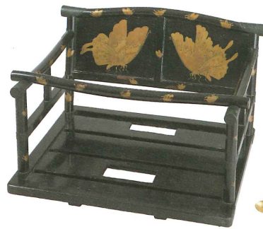
池田光政所用 《泊蝶紋蒔絵馬槽》 江戸時代前期(17世紀)