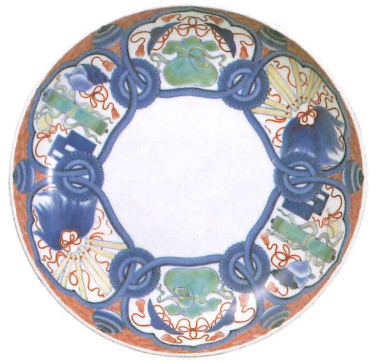
《色絵宝尽文大皿》 江戸時代中期(1700~1720年代)