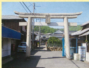
両神鳥居(倉敷市児島下の町)