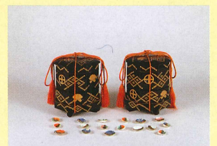
破七宝繋九十字牡丹紋時絵雛道具 (貝桶・彩色貝) 明治時代