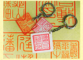
プラバンで作った県のハンコ

(小学生とその保護者の方対象・1組3人まで) 応募者多数の場合は抽選を行います。