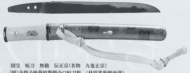
国宝 短刀 無銘 伝正宗(名物 九鬼正宗) (附)金梨子地葵紋散鞘合口短刀拵 (林原美術館所蔵)

この度は、全国の刀匠・刀職者から、外装付短刀等の作品を募り、優秀な作品を選出し、総出品数44件(総合の部7、刀身の部30、外装の部7)を展覧いたします。同時に林原美術館所蔵の御刀(国宝3口、重要文化財9口)、人間国宝の御刀1口、縁起の良い刀装具8点、池田家伝来の刀掛1基を展覧いたします。現代まで引き継がれてきた日本刀の伝統美をご堪能いただければ幸いです。