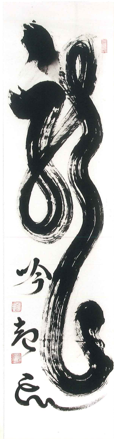
「龍吟起雲」 軸装 墨蹟