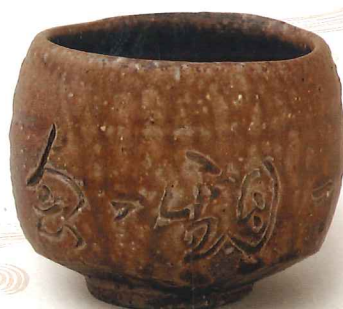
茶盃「一期一会」 金重懐作 原田老師彫