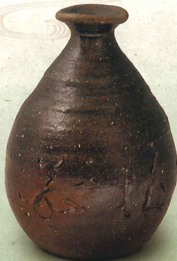
花入「拈花」 金重懐作 原田老師彫